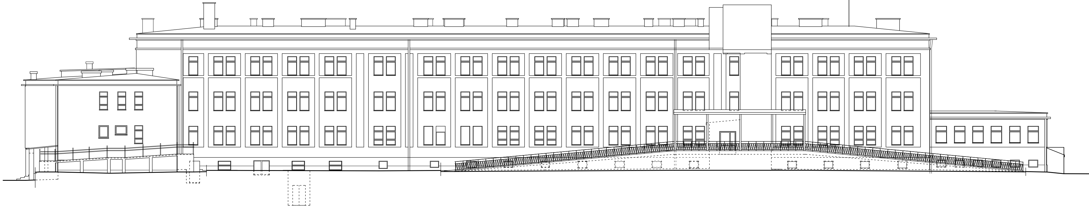
ELEWACJA POŁUDNIOWO - WSCHODNIA