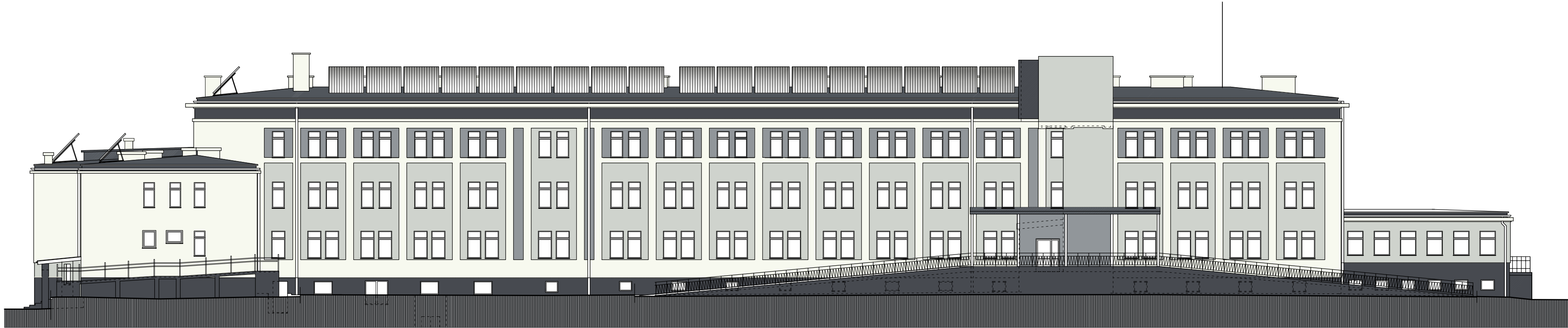
ELEWACJA POŁUDNIOWO - WSCHODNIA